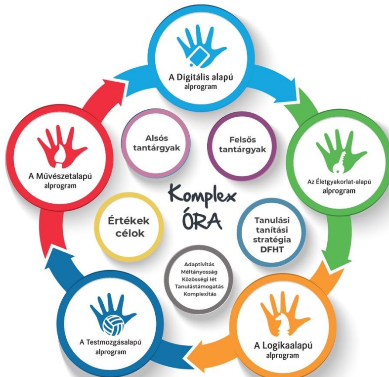
A Komplex órák felépítése